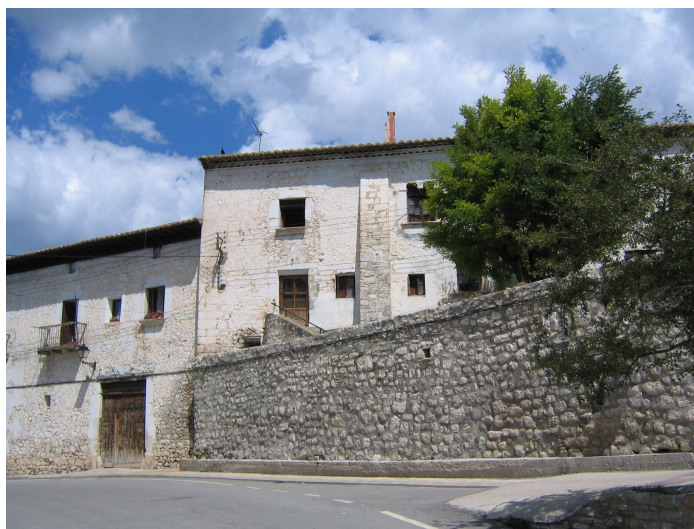
Casa del Mayorazgo de los Tonda